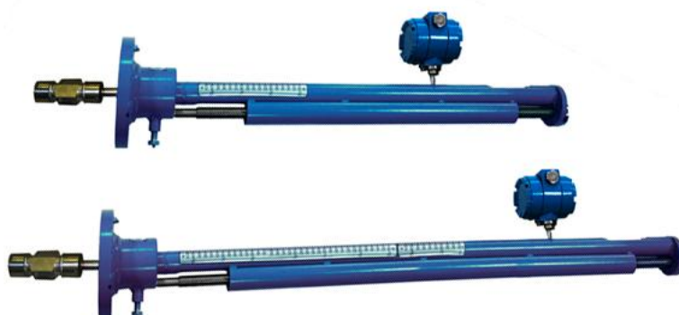
Рисунок 3 - Общий вид датчиков расхода ДРС модификации ДРС.3(Л)