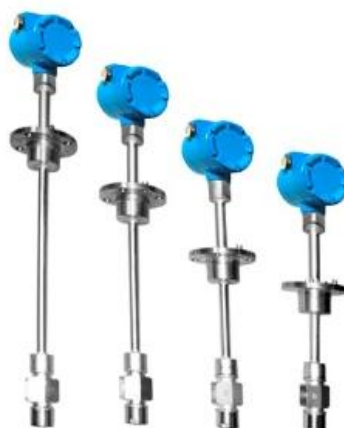
Рисунок 2 - Общий вид датчиков расхода ДРС модификации ДРС.3