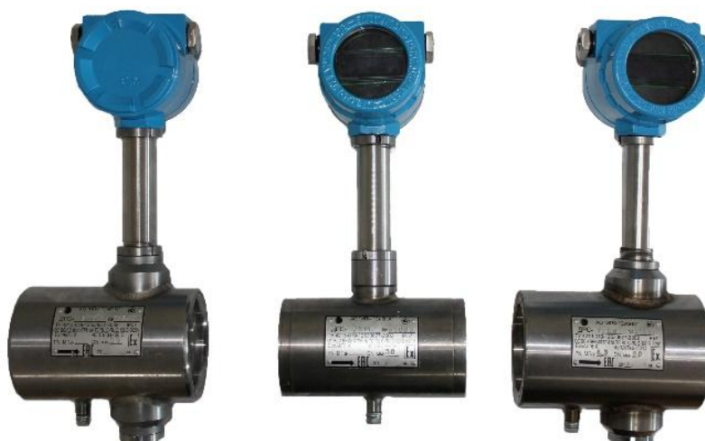
Рисунок 1 - Общий вид датчиков расхода ДРС модификации ДРС

Пломбировка от несанкционированного доступа датчиков расхода ДРС осуществляется нанесением знака поверки давлением на специальную мастику, установленную в чашечке винта крепления платы индикации или защитного экрана, расположенных под передней крышкой электронного преобразователя. Схема пломбировки от несанкционированного доступа, обозначение места нанесения знака поверки представлены на рисунке 4.